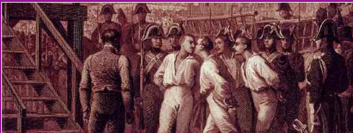
Exécution des 4 martyrs de la liberté en place de grève.

Association "Pour la Mémoire d'Achères", 20, rue du 8-Mai, Porte 12 et 8, rue Deschamps-Guerin 78260 Achères.