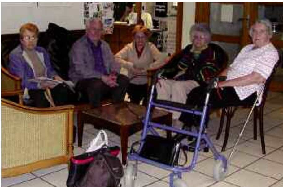
Présent sur le terrain : ici avec des personnes âgées pendant les travaux du foyer-logement Pompidou.