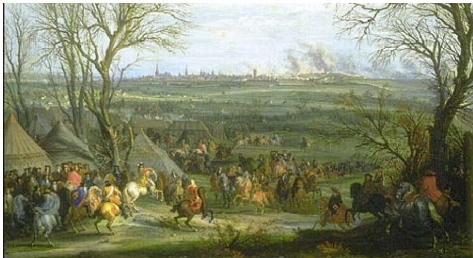
Camp militaire sous Louis XIV - toile d'Adam Frans Van des Meulen.

Le fort Saint-Sébastien, vraisemblablement construit vers 1670, occupait à Fromainville l'espace entre la forêt et la Seine, juste en face Herblay. Le fort hérissé de nombreux bastions (trois principaux sur chaque face, plus deux petits), était protégé par des contrescarpes et bastillons.