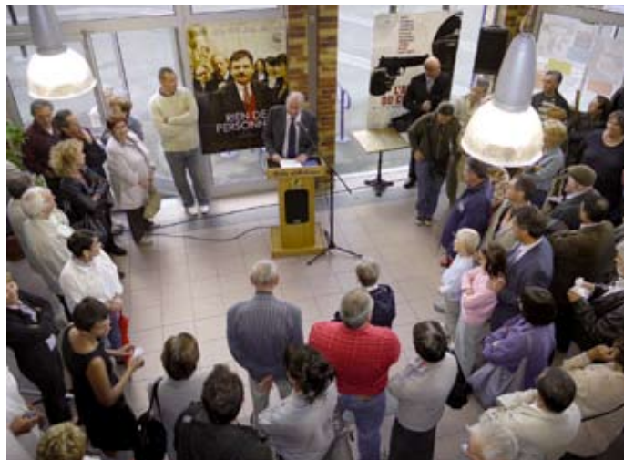
Le maire a assuré le cinéma du soutien indéfectible de la municipalité face à la "féroce concurrence des multiplexes".

La fanfare était de sortie, vendredi 4 septembre, pour accueillir le public achérois présent à l'inauguration du Pandora. Les nombreux cinéphiles avaient hâte de découvrir in situ les nouvelles installations du cinéma*.