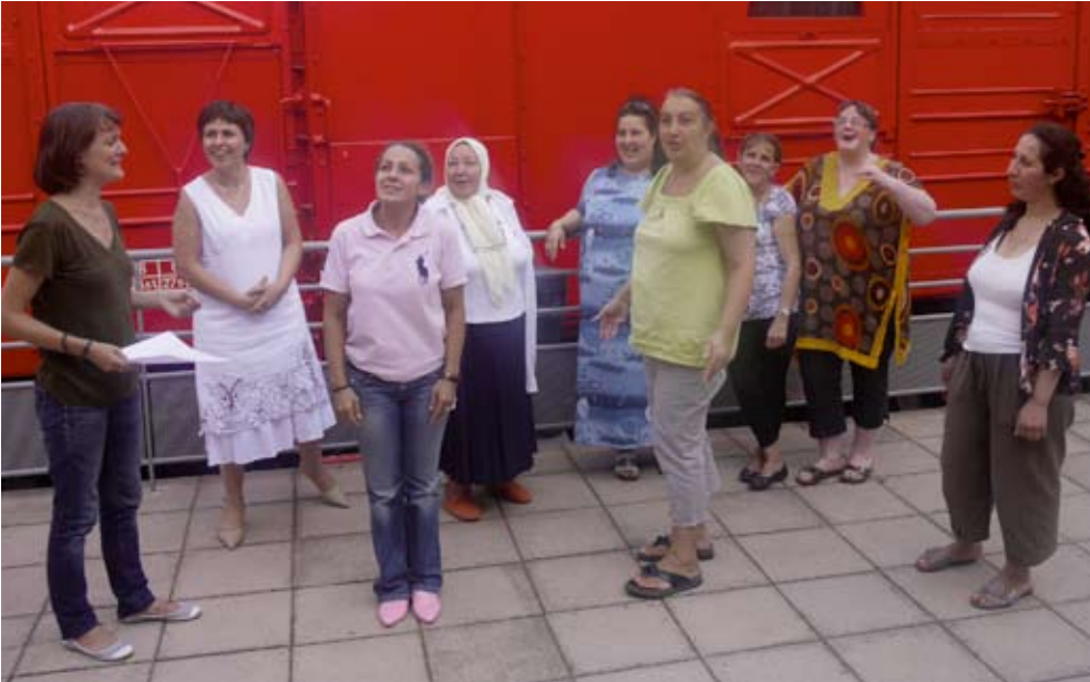
Pour leur première expérience théâtrale, les femmes du groupe GLV sont enthousiastes et motivées.

Le groupe GLV - "Gardons le Lien dans la Ville" - propose aux Achérois une pièce de théâtre sur la maladie d'Alzheimer, samedi 24 octobre à 20h 30 au Sax. Une représentation suivie d'un débat animé par une gériatre de l'hôpital de Saint-Germain-en-Laye.