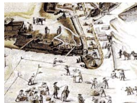
Construction de fortification militaire sous Louis XIV.

La route de Saint-Germain par Les Loges perdit alors son ancien nom de "Chemin des vaches" au profit de celui de "Chemin du Roi" car l'ancienne voie utilisée pour aller faire paître les bestiaux en forêt était devenue l'itinéraire suivi par le roi pour venir de Versailles aux camps d'Achères.