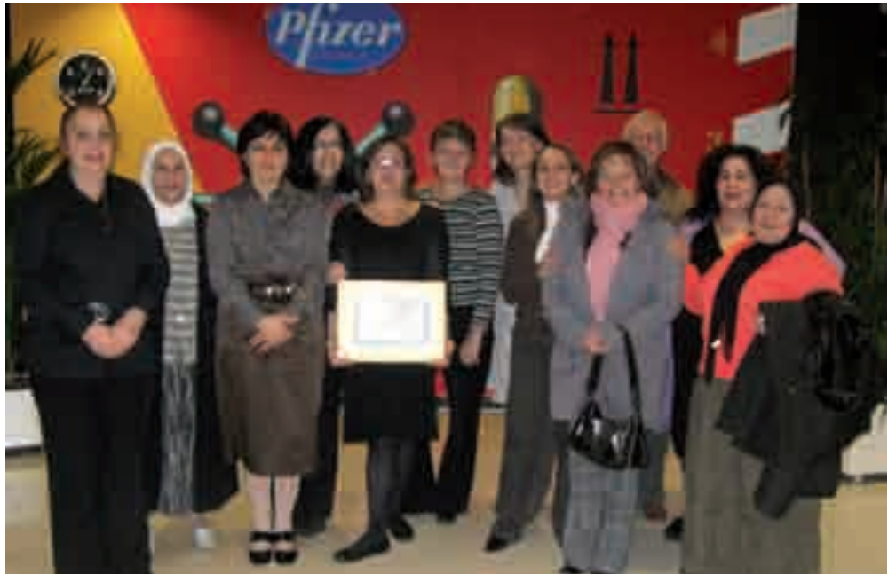
Accompagnées, les femmes du groupe GLV sont venues en force recevoir leur récompense.

Après avoir remporté un beau succès au Sax, en octobre dernier, avec la pièce de théâtre sur la maladie d'Alzheimer*, le Centre communal d'action sociale (CCAS), par son action menée avec les femmes du groupe "Gardons le lien dans la ville", vient de recevoir, le 15 décembre, un prix de la Fondation Pfizer France récompensant ce projet original.