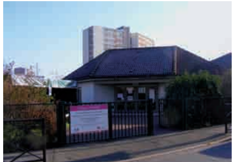
La maison Marcel-Pagnol, à l'angle des rues du 8-Mai-1945 et Jean-Gabin, abrite les deux centres de vaccination achérois.

lauréats au concours seront responsables d'une classe sans expérience préalable ni formation professionnelle ? Cantonnés à l'encadrement des stages, les IUFM sont-ils appelés à disparaître ? L'allongement de la durée d'études ne s'accompagne pas d'un réel soutien financier (quid des catégories sociales moins favorisées ?). Pour les opposants à la réforme, si le projet est adopté en l'état, la rentrée 2010 s'annonce d'ores et déjà difficile pour ne pas dire explosive.