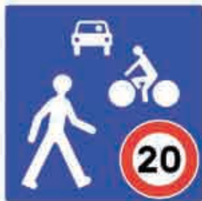
La signalétique des zones de rencontre montre nettement l'ordre des priorités

Nouvellement créée dans la réglementation, la zone de rencontre est ouverte à tous les modes de déplacement. Les piétons bénéficient de la priorité sur tous les véhicules (à l'exception des tramways) et peuvent se déplacer sur toute la largeur de la voirie. Seule la limitation de la vitesse des véhicules à 20 km/h rend cela possible. Les cyclistes y circulent à double-sens sur toutes les chaussées y compris sur les voies en sens unique pour les véhicules motorisés. Le stationnement n'est autorisé que sur les emplacements matérialisés.