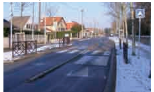
En 2002 à cet endroit (av. de Conflans) la police notait 7 accidents légers (1 piéton, 3 motards, 2 cyclistes, 1 automobiliste). Depuis la mise en place de ces dispositifs en 2006, aucun accident n'été constaté.

En l'absence de passage piéton, les piétons peuvent traverser où ils le souhaitent tout en restant vigilants.