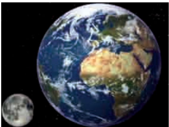
Conférences et expositions autour de l'astronomie par l'association Orionis à la bibliothèque.