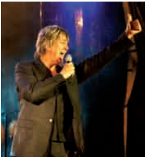
Concert de Jacques Higelin