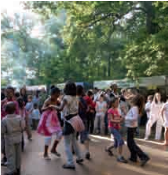
Fête de l'Amitié