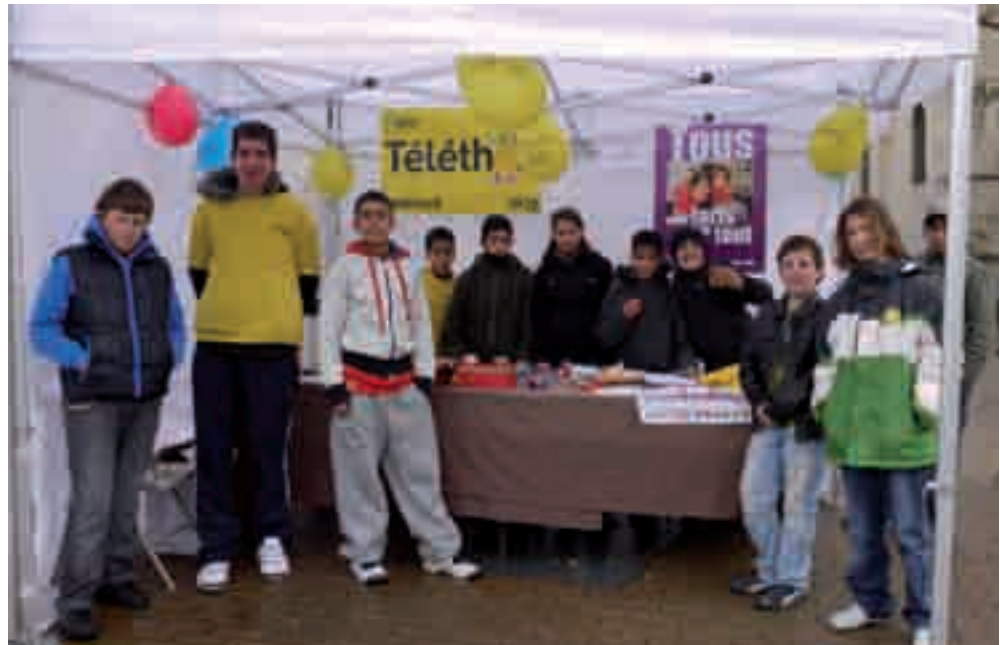
Les jeunes du Club franquin vendent des bougies faites lors de leurs ateliers créatifs au profit du téléthon.

L'année dernière, Antonio Masina, président de l'OMS, avait émis le souhait qu'Achères et les Achérois se mobilisent encore plus pour la noble cause du Téléthon. Il a été entendu : les organisateurs ont récolté 600 euros de plus qu'en 2008, ce qui est considérable ! La somme recueillie à l'issue des deux jours du Téléthon est de 7306,67 € (contre 6694,84 € l'an passé).