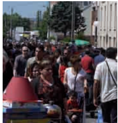
Fête de la Pentecôte