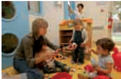
Crèche multi-accueil Lucie-Aubrac