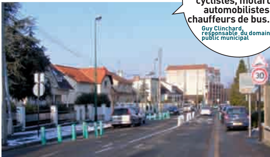
Les aménagements provisoires en face le groupe Joliot-Curie préfigurent les systèmes de rétrécissement de voies à l'entrée des zones d'application du code de la rue.

À partir de l'exemple concluant de pays voisins, l'idée d'un code de la rue a émergé.