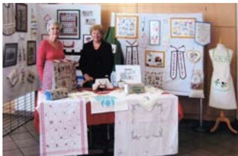
Les travaux des résidents du foyer Pompidou réalisés lors des ateliers points comptés et peinture.