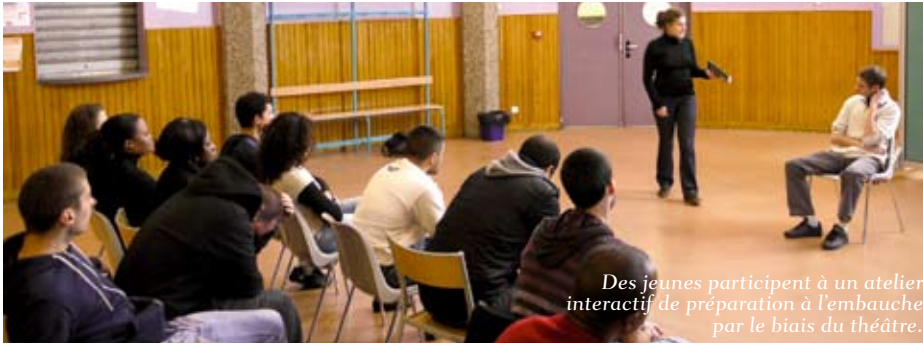
Des jeunes participent à un atelier interactif de préparation à l'embauche par le biais du théâtre.

La ville, en créant le Saref, a depuis longtemps placé l'emploi au cœur de ses priorités. En se voulant un outil de proximité, le Saref vise en premier lieu les habitants des quartiers dits « ZUS ». L'objectif est atteint puisque 55 % environ des personnes suivies habitent aux Plantes d'Hennemont ou aux Champs-de-Villars. En déménageant le Saref dans les locaux du centre de formation en juillet dernier, la ville a souhaité rapprocher ce service des habitants des quartiers.