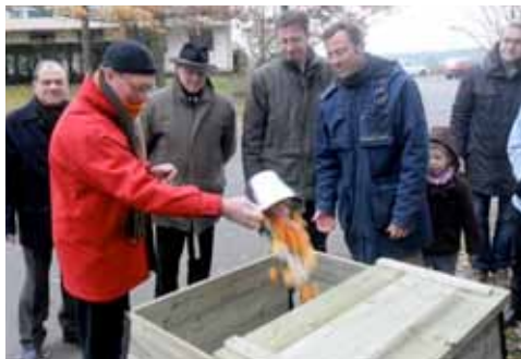
Premier dépôt de déchets verts dans les composteurs disposés à la résidence de l'Orée du Bois.

Samedi 27 novembre, en prélude à l'opération « Qui veut sauver la planète ? » (voir Achères Aujourd'hui n°14), le lancement du compostage collectif a été initié à la résidence de l'Orée du Bois. Une opération d'importance faisant de cette résidence le premier site achérois du genre.