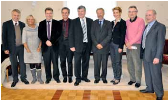
Les maires des communes voisines de Poissy se donnent deux ans pour réfléchir à la meilleure union possible

Quoi de mieux que la salle des Mariages pour annoncer une future union ? Jeudi 13 janvier, en mairie de Poissy, une dizaine de maires - dont celui d'Achères - se sont réunis pour annoncer la création d'une association de préfiguration, étape préalable à l'intercommunalité qui devra être effective en 2013.