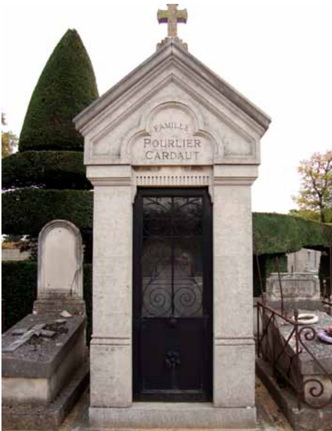
Le caveau de la famille Pourlier-Cardaut au cimetière communal

La traditionnelle cérémonie de présentation de la Rosière de la ville qui se déroule durant la fête de Pentecôte revêt un aspect historique du fait des deux legs offerts par deux Achéroises, à plus de 75 ans d'intervalle, à la jeune fille la plus méritante élue par le Conseil municipal.