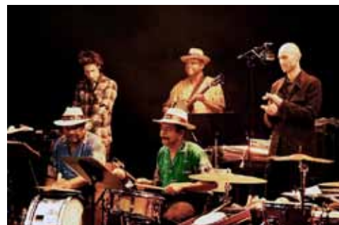
La Réunion commémore l'abolition de l'esclavage lors de la Fêt Kaf avec l'Amicale Ma-Zo, Lafous, La Muse à Zézette et Lorkès en Kuiv Karroussèl.

D ans le cadre de son partenariat avec le festival Africolor, le Sax a accueilli deux concerts exceptionnels les 19 et 24 décembre 2010. Un premier rendez-vous dédié à la culture maloya, lors de la Fêt Kaf, avec un concert de musique réunionnaise, suivi par un Noël mandingue mettant à l'honneur la culture malienne.