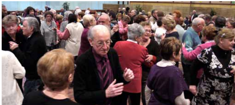
Comme le veut la tradition, le goûter des anciens se termine sur la piste de danse...