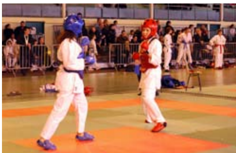
Les filles aussi aiment bien en découdre sur le tatami !

Pour la 2 e année consécutive, le Cloca karaté a organisé le championnat départemental de kumité, le combat conventionnel du karaté, les 22 et 23 janvier derniers au gymnase de la Petite-Arche. Comptant pour le championnat de France, cette compétition a regroupé 400 karatékas dans les catégories minimes, cadets, juniors