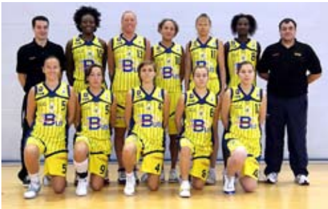
La Côte d'Opale, l'équipe de basket de Calais fera découvrir cette discipline le 9 mars prochain.

Le Comité départemental de basket-ball, le service des Sports de la ville et le Cloca vous invitent à participer à l'opération « Mairraines de Cœur » le 9 mars 2011. Lancée par la Ligue féminine de basket, cette opération, relayée par le comité des Yvelines, s'adresse aux jeunes filles. Une action à la fois sportive, citoyenne et sociale qui vise à faire découvrir le basket au plus grand nombre par le biais d'ateliers animés par des joueuses professionnelles. Et pour l'occasion, l'équipe la Côte d'Opale