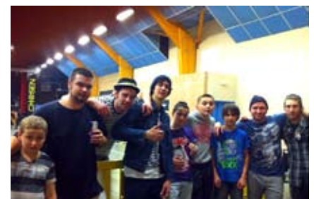
Les adhérents ayant participé à chaque qualification le samedi et le dimanche.