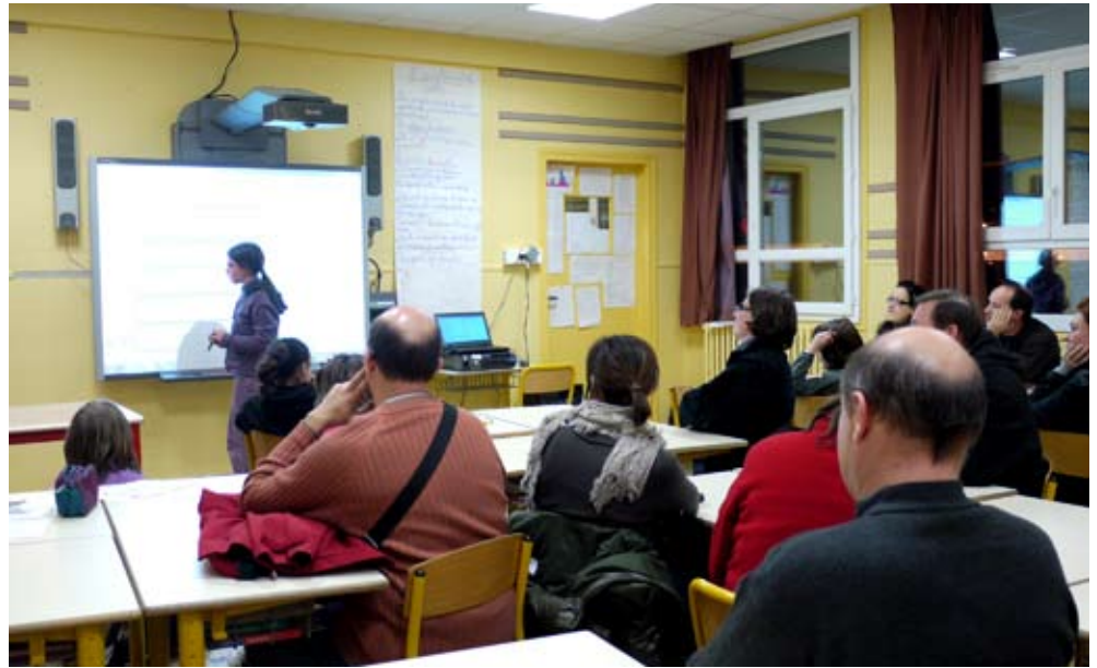
Les parents ont découvert le tableau numérique interactif rapidement adopté par les écoliers.

Les nouvelles technologies entrent à l'école. Les 21 et 25 janvier derniers, les parents ont été conviés par la municipalité à découvrir un nouvel équipement appelé à se répandre dans les classes élémentaires : le tableau numérique interactif (TNI). Un outil pédagogique qui fait déjà l'unanimité.