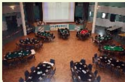
Le calme avant l'excitation du jeu ?

D imanche 8 mai, 90 joueurs ont répondu à l'appel de l'association achéroise Club Poker 78 qui organisait un tournoi caritatif en faveur des victimes du séisme d'Haïti. Les joueurs de poker ont du cœur, qui en doutait ? Le tournoi proposé par le Club Poker 78 en faveur de l'association Solidarité Achères-Haïti, qui avait préparé la restauration, a attiré des joueurs locaux mais aussi de Seine et Marne, de Champagne et même 6 professionnels. Au terme de cette journée, 1000€ ont été versés à Solidarité Achères-Haïti afin d'aider les sinistrés de la ville de Thomazeau. Un reportage télé sur l'événement est visible sur le site d'Yvelines Première (journal du 18 mai 2011).