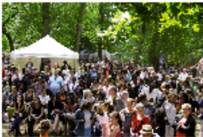
Cette année encore, la fête de l'Amitié a remporté un grand succès. Vous retrouverez tous les moments forts en images dans le prochain numéro de votre magazine.