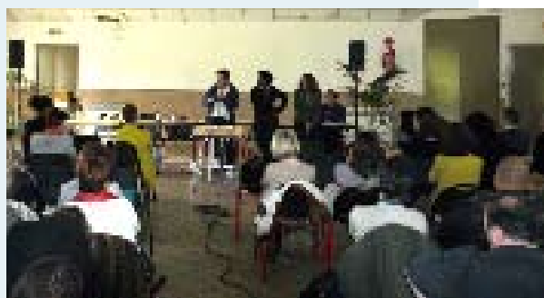
Premier contact fructueux entre les acteurs du Département et de la Ville.

Cette journée du 5 avril s'est déroulée en deux temps : une matinée consacrée à une présentation générale de la ville et de la démarche globale ainsi qu'un descriptif des ateliers de travail regroupant les partenaires en fonction de leurs compétences. Puis l'après-midi, la réflexion au sein des 4 comités techniques formés a été lancée. Il s'agissait de partager et d'échanger des idées et points de vue sur les constats rencontrés au sein de chaque problématique. En fin de journée, une réunion commune a permis de restituer le travail des participants avant que chaque groupe ne se réunisse deux fois pour poursuivre la réflexion et affiner les actions à développer au regard de l'existant. S'appuyant sur les résultats de cette rencontre, le Conseil général proposera un contrat d'objectifs et de moyens à la Ville, courant dernier trimestre 2011, lequel sera ultérieurement présenté en séance plénière.