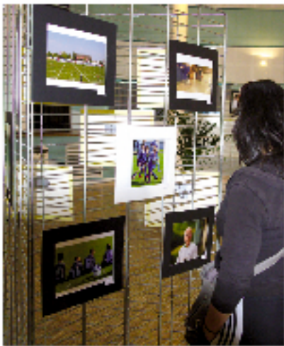
COCA et CLOCA, plateformes pour les "Besoins et attentes sociologiques" (p.18).