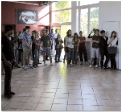
225 jeunes Achèrains ont participé à la cérémonie citoyenne de rendre des cartes d'objectifs (p.14).