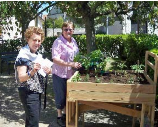
Les tables jardinières : la terre est basse ? Remontons-la !

Depuis la fin mai, les résidents du foyer Pompidou peuvent s'adonner aux plaisirs de la culture grâce à des jardins sur table installés en extérieur. Une initiative de la municipalité qui répond au souhait des seniors.