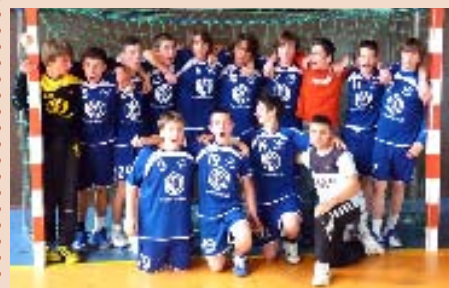
Cette année nos jeunes joueurs de la catégorie -16 ans de la section handball se sont distingués en finissant 1 er (sur 6 équipes) au Championnat départemental, niveau Excellence. Félicitations à l'ensemble de l'équipe pour ce beau résultat !