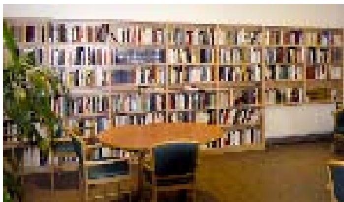
Le classement réalisé par les bibliothécaires a permis de mettre en valeur des livres jusque-là peu visibles.

Dans un même souci de service au public, le foyer Pompidou et la bibliothèque municipale ont à cœur de poursuivre ce partenariat afin de multiplier les liens entre les deux structures. D'ores et déjà, les résidents venus emprunter des livres à la bibliothèque municipale pourront, s'ils le souhaitent, être accompagnés par un bibliothécaire qui portera leurs livres.